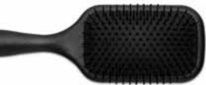
Bürste Denman D83 Large

Für Traumlängen gilt es, das Haar möglichst lange in der Wachstumsphase zu halten. Die Kopfhautpflege mit dem Growth Booster stimuliert die Zellaktivität an der Haarwurzel, während das Hair & Nail Strengthening Food Supplement gesundes, kräftiges Haarwachstum von innen unterstützt.